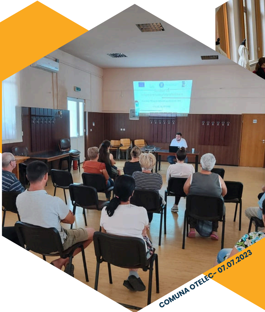
COMUNA OTELEC - 07.07.2023

PREZENTAREA OPORTUNITĂȚILOR DE FINANȚARE PRIN GAL BANAT-VEST